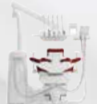
Rechts- Links Version Assistenzelement

Lieferumfang gemäß Aktionsbeschreibung – ohne optionale/ aufpreispflichtige Ausstattungen wie Arbeitsstühle, Patienten-kommunikation CONEXIOcom Vision, CONECTbase Vision und RELAXline Softpolster. Abbildung kann weitere optional erhältliche Ausstattungen enthalten. Details und Preise zu abgebildeten oder weiteren Ausstattungsvarianten nennt Ihnen gerne Ihr Dental-Union Fachhandelspartner.