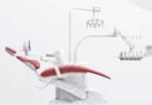
KaVo uniQa S