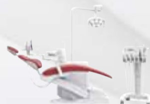
KaVo uniQa C