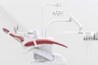
KaVo uniQa T